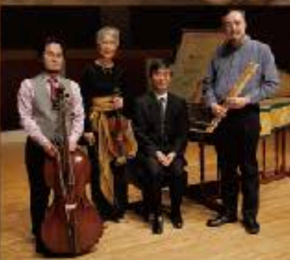
(すべて公演で都合による曲目変更があり得ます)